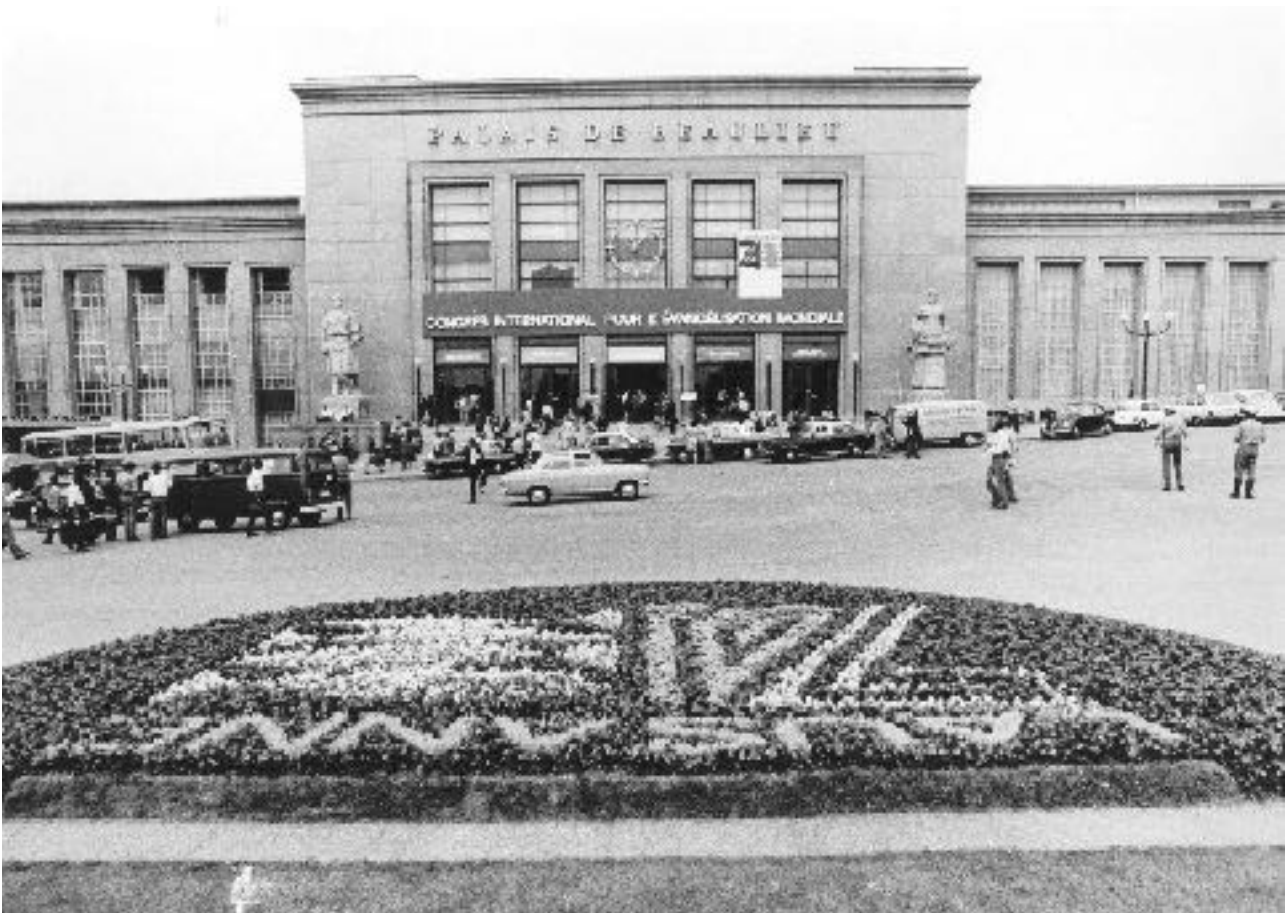
I partecipanti arrivano al Palais de Beaulieu, il luogo dello storico Congresso Internazionale per l'Evangelizzazione del Mondo.

Cinque anni più tardi, nel 1971, Billy Graham organizzò un incontro per discutere sulla possibilità di un altro raduno che avesse lo scopo di analizzare i progressi fatti dopo il 1966 e per riflettere con maggiore attenzione sulle sfide più importanti per la chiesa – politiche, ideologiche e teologiche – e come queste avessero un impatto sull'evangelizzazione. Qualche mese più tardi iniziavano i preparativi per il grande raduno, che ebbe luogo nel 1974 a Losanna, Svizzera. Gli fu dato il nome di Congresso Internazionale per l'Evangelizzazione del Mondo (in seguito definito anche Losanna I)